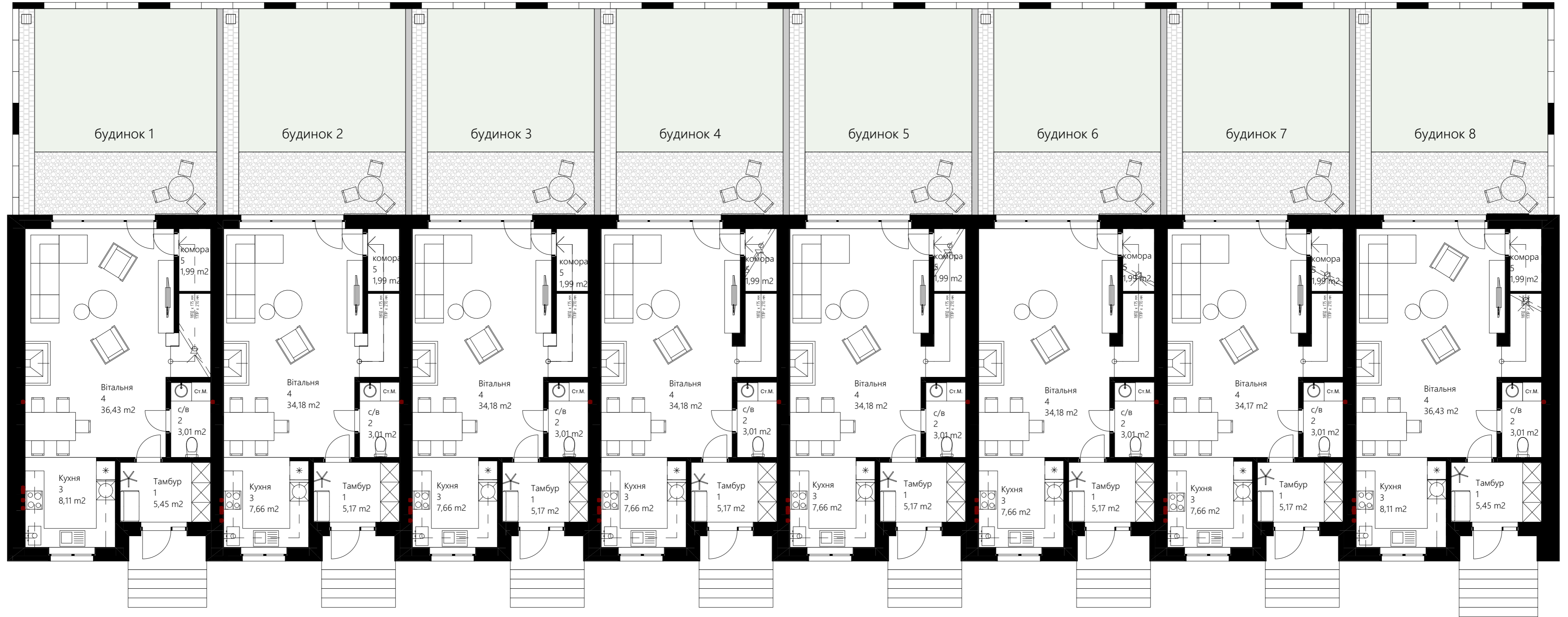
схема розміщення меблів 1-го поверху